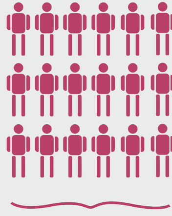
55% Fachabitur oder Studium